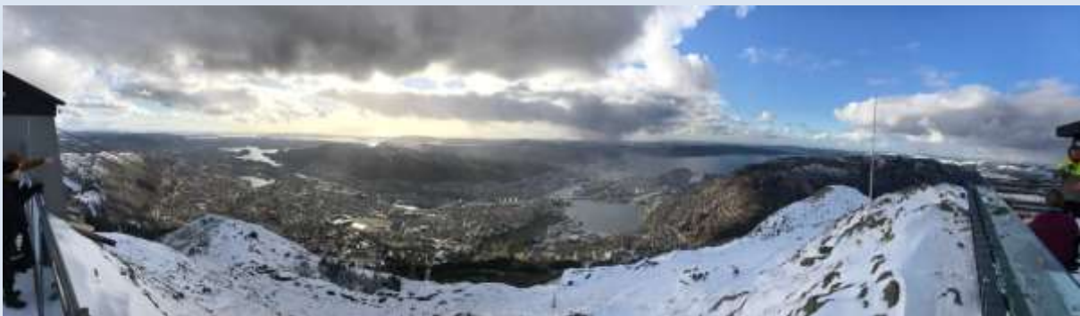
Blick über Bergen nach erklimmen der schneebedeckten Gipfel

Ein Blick in die andere Richtung war ebenso schön, denn Bergen wirkt zunächst recht klein, denn im Hafenviertel bietet sich schon so viel an, dass man dort ein ganzes Wochenende verbringen könnte, dahinter aber liegt noch eine ganze Stadt, versteckt in den Schluchten der Berge. Um den Nachbarberg herum zieht sich die Stadt, bis Sie dann wieder an die Küste ragt. Das konnte man von dort oben aus gut sehen. Dort oben lag auch leichter Schnee, der die Wege zwischen den Bäumen bedeckt hatte. Es war ein idyllischer Ort, direkt neben einer großen Stadt und schnell erreichbar.