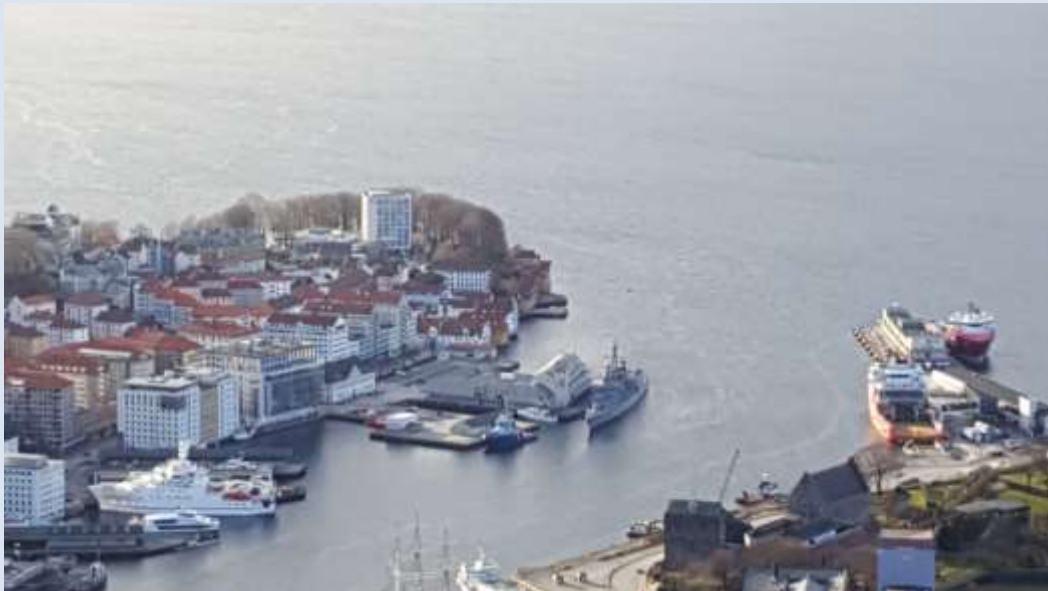
Fregatte LÜBECK im Hafenbecken von Bergen

18. März 2017, 8 Uhr morgens in Bergen, Norwegen. Die Sonne geht langsam über dem Fjord auf, in der Ferne werden die kleinen Inseln von einer großen ca. hundert Meter hohen Nebelwand verschlungen. Auf jeder Insel sind Berge, deren Gipfel sich über den Nebel erstrecken und noch erkennbar machen, wie weit weg sich das Ganze noch abspielt. Über uns war der Himmel wolkenlos, es war kalt, aber nur wenig Wind zog über das Flugdeck, wo gerade die Flaggenparade vollzogen war. Als ich mich auf die Reeling der Backbordseite lehnte und Richtung Vorschiff blickte, blickte ich in die Stadt Bergen hinein. Viele Schiffe lagen im Hafen, unterschiedlichster Art, gleich abgelöst von der Innenstadt mit vielen Läden, Cafés und Restaurants. Hinter den Häusern streckten sich die Berge in den Himmel, auf deren Abhängen zum Teil noch Häuserreihen standen. Die schneebedeckten Bergkuppen gaben dem malerischen Bild noch den letzten Schliff und das Alles im goldenen Sonnenlicht der frühen Morgensonne.