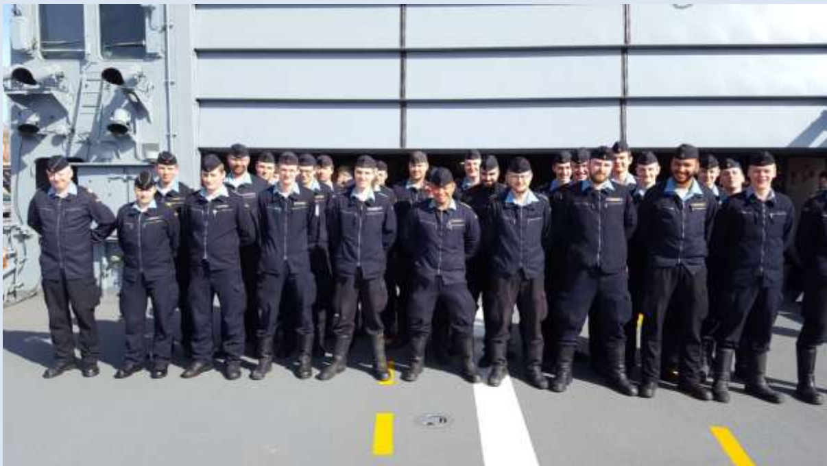
Hauptabschnitt 100 (April 2017)

Den Anfang soll in dieser Ausgabe der Hauptabschnitt 100 machen. Dieser trägt den Titel Nautik und umfasst jegliches Personal, welches für die nautische sowie seemännische Sicherheit der Fregatte LÜBECK verantwortlich ist. Die Männer und Frauen des Hauptabschnitts 100 teilen sich nochmals in zwei Abschnitte auf, zum einen in die Navigation, zum anderen in den Decksdienst.