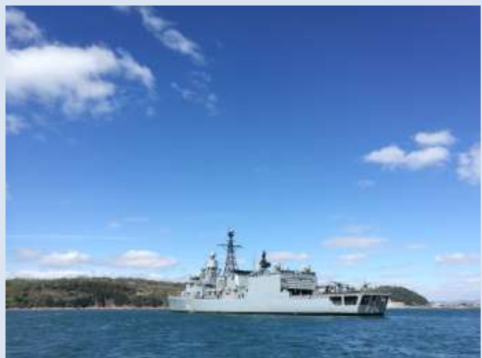
Die Fregatte LÜBECK vom Speedboot aus aufgenommen (Plymouth / Höhe Breakwaters) mit dem Wildcat Hubschrauber auf dem Flugdeck

Wir Mannschaften sind und bleiben nun mal das Rückgrat der Marine, denn wir können nicht nur in Rekordgeschwindigkeit für niedere Arbeiten angelehrt werden, sondern sind auch universell einsetzbar. Daher werden wir auch getauscht und verliehen wie Panini-Sammelsticker. Und dabei sind wir fast genauso sehr genügsam und brauchen weder Privatsphäre noch Ruhepausen, ein Bock wie in einem Hühnerstall, minderwertige Mahlzeiten und lediglich funktionierende Toiletten reichen völlig aus. Und kurz bevor die Stimmung umschwenkt, lassen Einlaufen und das obligatorische Einlaufbier die Schrecken des wöchentlichen Krieges langsam verschwinden.