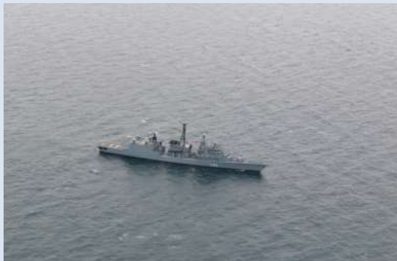
Die Fregatte LÜBECK aus der Luft im Seegebiet vor Plymouth

Wieso der Rest? Nun, wir Mannschaften vereinen zahlreiche Hilfsarbeiterberufe. Wir sind Platzwarte, Müllmänner, Kellner, Maler, Klempner, Hausmeister, Sekretäre, Einlasskontrolle, Ultra und Klofrau in einem! Aber die Champions League wäre keine Herausforderung wenn man bloß all diese Aufgaben auf Stadionniveau erfüllen würde. Und deshalb wurde täglich von 5 Uhr morgens bis 22 Uhr abends hart dafür geschuftet Meister in allen Disziplinen zu werden. Denn z.B. bei einer Fehlwurfquote von 55% in dt. Haushalten, kann vermutlich fast niemand von sich behaupten, seine Mülltrennung sei Meisterhaft, außer die Mannschaften der Fregatte „Lübeck“, denn wir haben es trotz strengster Kontrollen durch die Schiedsrichter geschafft den Müll fehlerfrei zu trennen. Jetzt fragen sie sich bestimmt, wie solch eine Glanzleistung möglich war. Da alles was in Plymouth Lebensmittel berührt hat zu Biomüll wurde, war es nur von Nöten alles irgendwie mit Lebensmitteln zu kontaminieren um es dann sauber in den royalen Biomülltonnen zu entsorgen.