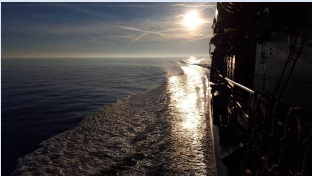
Bild vom Transit Richtung Wilhelmshaven

Navigateure bestimmten früher mit Stechzirkel, Dreieck und Seekarte den aktuellen Standort des Schiffes, gaben Kursempfehlungen und sorgten für die nautische Sicherheit. Heute steht dem Navigationspersonal nebst dem alten Material auch moderne Technik zur Verfügung, um ihre Aufgaben zu erfüllen. Dazu gehören GPS, Radar und elektronische Seekarte. Trotzdem werden alte Navigationsmethoden, wie zum Beispiel die Navigation nach den Gestirnen, nicht außer Acht gelassen und finden sich, wie selbstverständlich, auch heute noch in den Ausbildungsgängen angehender Navigateure wieder. Ebenfalls sorgt sich die Navigation um die urkundliche Dokumentation einer jeden Seefahrt. Während der Seewache, bei der die Navigateure dem Wachhabenden Offizier auf der Brücke beratend zur Seite stehen, beobachten und analysieren sie auch regelmäßig das Wetter und tätigen mit Hilfe von meteorologischen Vorhersagen Aussagen über dessen Verlauf.